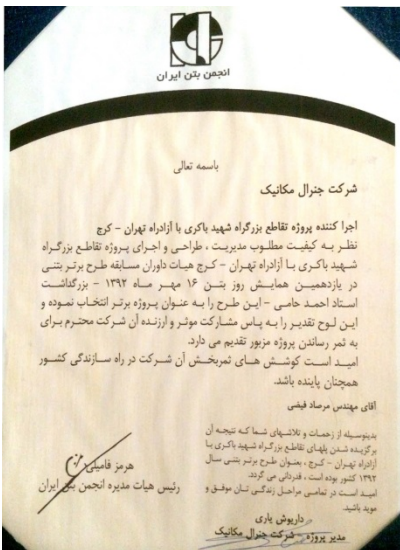
لوح تقدیر طرح برتر بتنی