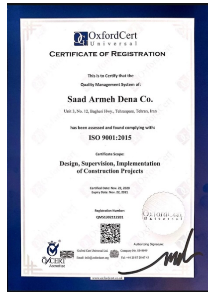
گواهینامه استاندارد ایزو ۹۰۰۱