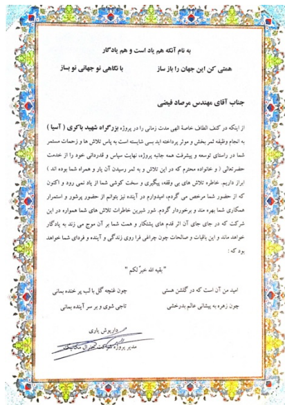
لوح تقدیر پروژه بزرگراه باکری